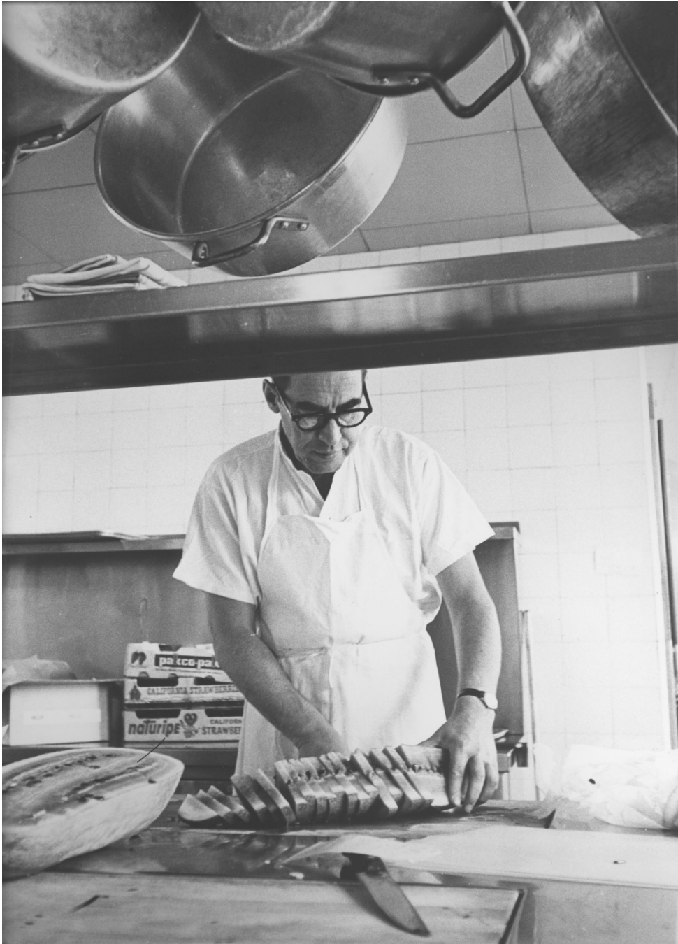
Bénévole coupant des melons d'eau lors de la grève de l'été 1966, Hôpital général de Montréal, 1966.

Centre d'archives du CUSM. 2014-0014.04.1658.